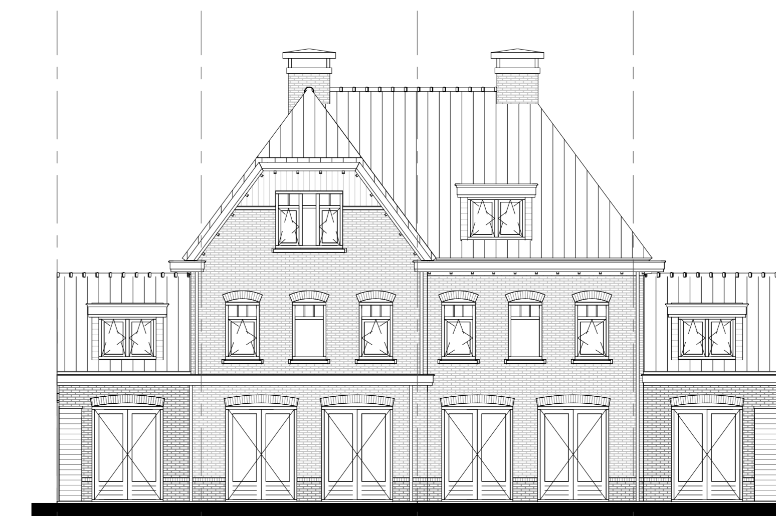
Achtergevel schaal 1:100

optie: -uitbouw 'achter' 1200mm optie: -E.01 dakkapel achter