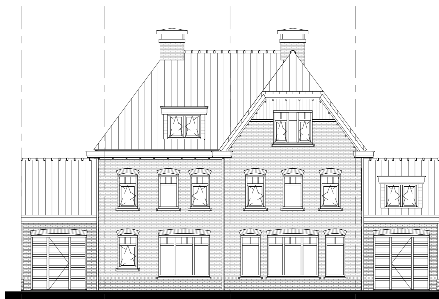
Voorgevel schaal 1:100

optie: -E.01 dakkapel voor. -E.01 dakkapel achter.