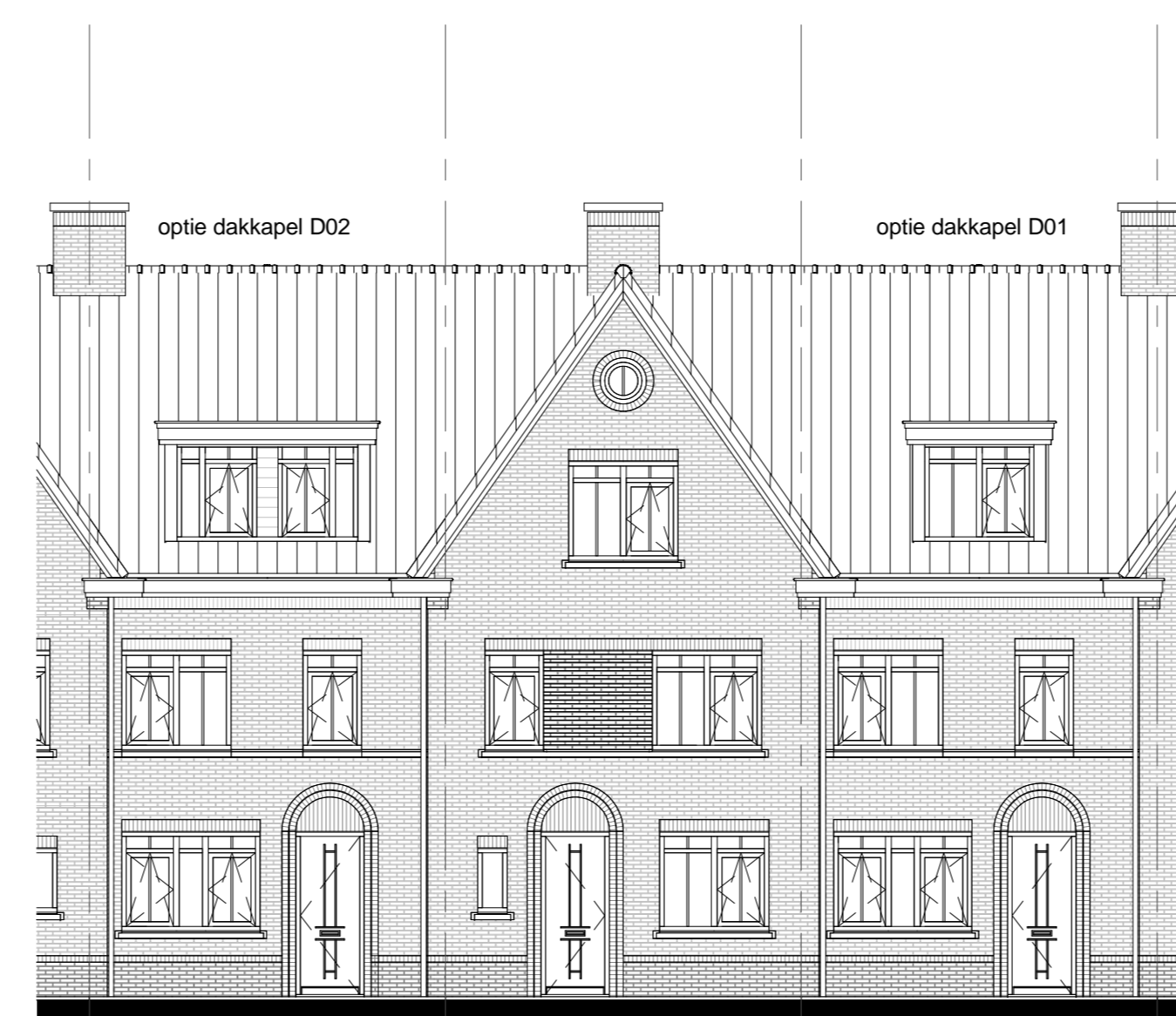
optie dakkapel D02 optie dakkapel D01 Bouwnummer 246/253 Bouwnummer 247/254 Bouwnummer 248/255