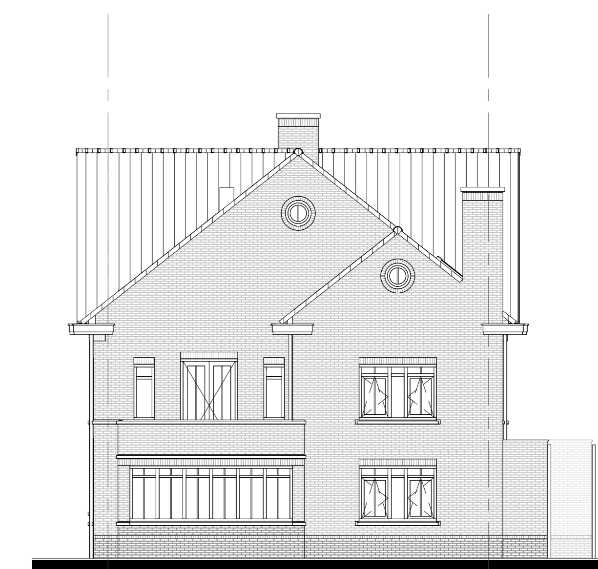
optie uitbouw 'hoek' 1200mm