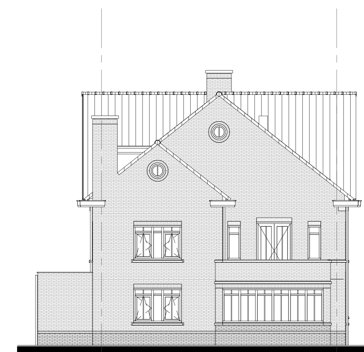
optie uitbouw 'hoek' 2400mm