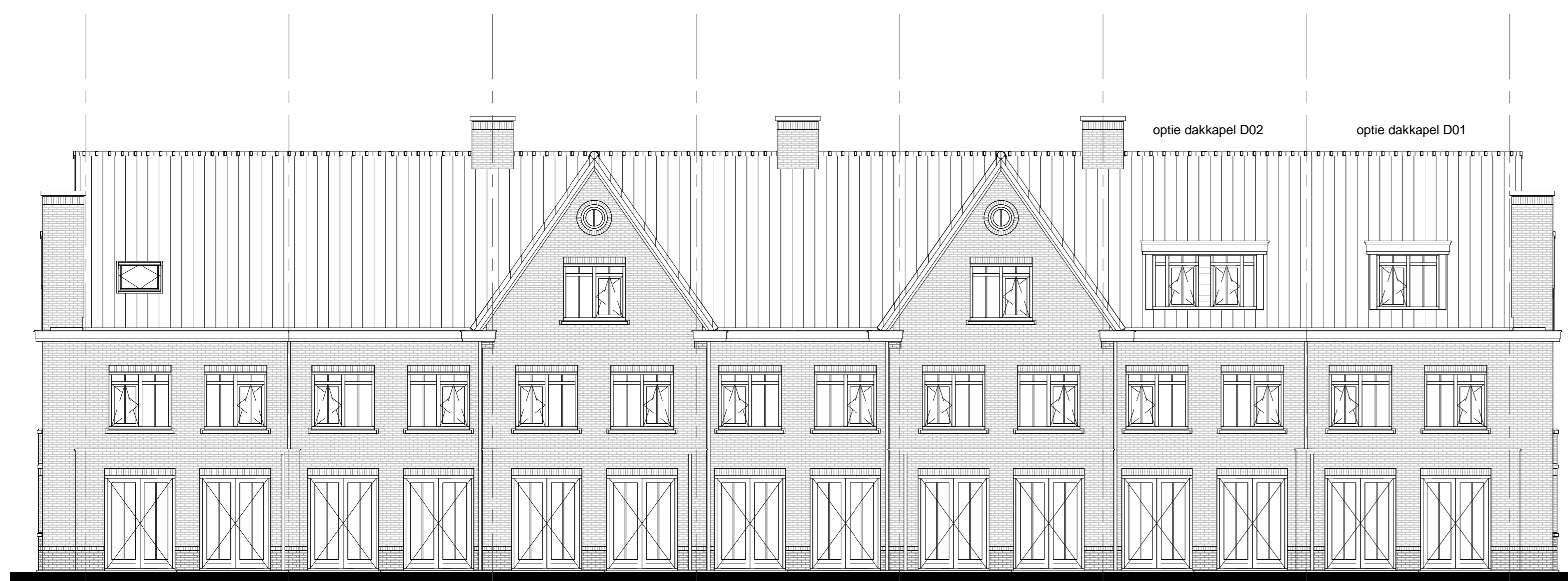
optie uitbouw 'hoek' 1200mm kozijnen gelijk aan basis Bouwnummer 250/257 optie uitbouw 'tussen' 1200mm kozijnen gelijk aan basis Bouwnummer 249/256 optie uitbouw 'tussen' 2400mm kozijnen gelijk aan basis Bouwnummer 248/255 optie uitbouw 'hoek' 1200mm kozijnen gelijk aan basis Bouwnummer 247/254 Bouwnummer 246/253 optie dakkapel D02 optie dakkapel D01 Bouwnummer 245/252 Bouwnummer 244/251